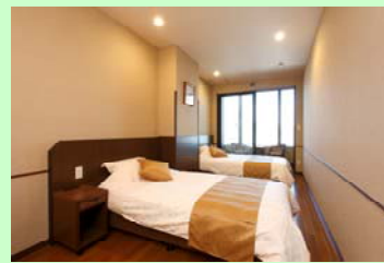
洋室ツインルーム